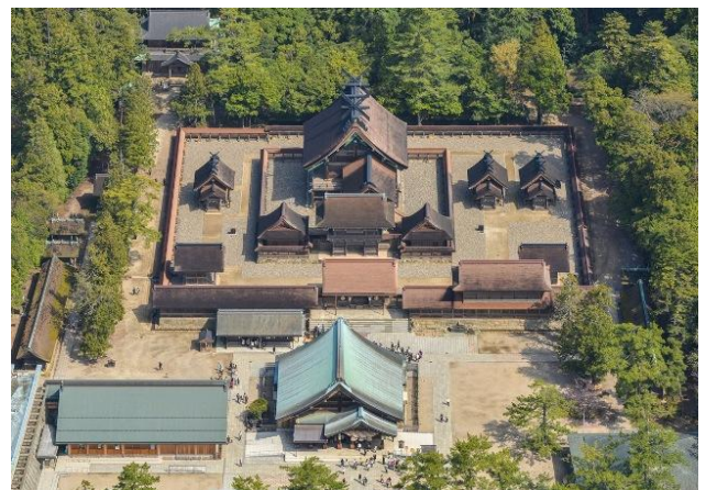
Fig 1. 出雲大社(本殿) [7]

地形条件や日照時間から効率よく長時間にわたり本殿正面に日照を受けられる方向を向いていることだけではなく、北方向を向いている神社の理由について調査を行う。