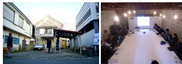
fig.3 2008年くしだ蔵プロジェクトの活動風景写真

市民活動への助成支援を行う複数の助成財団を選出し、助成支援の履歴を調べる。その履歴から複数の助成を受けた団体(以下被助成団体と記す)を選出し、助成支援をする側とされる側双方に対してアンケート・ヒアリングを行う。双方の助成支援に対する要望・ニーズを引き出すことを目的とし、動機・目的、助成金内訳、活動内容等について調査を行う。