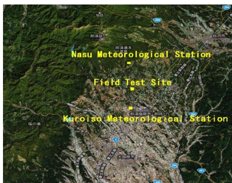
Figure2. Analysis Area

以下に評価対象地域を、栃木県那須郡近傍として風況予測を行った結果を示す。Figure2 に評価対象地域の地図を示し、Table1 に評価地点近傍に位置する気象官署における風速計高さとワイブル係数を示す。