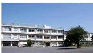
写真 3 東京都豊島区にあるみらい館大明 6)

参考文献 ; 1) ~未来につなごう~「みんなの廃校」プロジェクト HP, http://www.mext.go.jp/a_menu/shotou/zyosei/1296809.htm (最終閲覧日: 2018. 9. 23) / 2) 廃校施設等活用事例リンク集 HP, http://www.mext.go.jp/compoent/a_menu/education/detail/_icsFiles/afieldfile/2017/08/02/1296817_1.pdf (最終閲覧日: 2018. 9. 23) / 3) 廃校リニューアル 50 選 HP, http://www.mext.go.jp/a_menu/shotou/zyosei/03062401/frame-3.htm (最終閲覧日: 2018. 9. 23) / 4) アーツ千代田 3331HP, https://www.3331.jp/ (最終閲覧日: 2018. 9. 23) / 5) ROOMIEHP, https://www.roomie.jp/2015/03/238548/ (最終閲覧日: 2018. 9. 23) / 6) みらい館大明スタッフブログ HP, http://miraikantaimei.blogspot.com/2013/04/ (最終閲覧日: 2018. 9. 23)