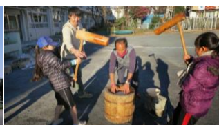
写真 4 地域のイベントが廃校で行われている 6)