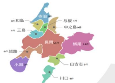
図 2-1-1 長岡市地域区分 4)