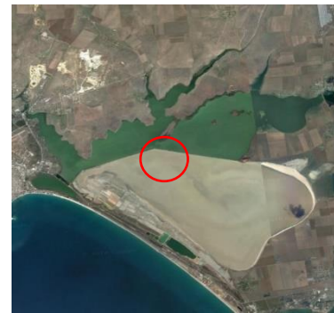
Figure 3 Place of the project in the Sasyk-Sivash lake

分かれており、海水の部分は 15 世紀から塩の採取と精製として利用され、ヨーロッパにおける大規模精塩施設三ヶ所ある中の一つに数えられている。