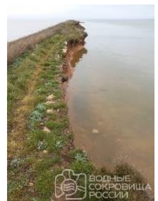
Figure 4 Current condition of the embankment of Sasyk-Sivash lake

しかし、堤防の幅は気候状況により 10m から 2m 以下に減少している(Fig.4) . この最小部分が破壊された場合には、淡水の水は海水に入り込み、独特な環境がなくなる恐れがある。そして、その破壊では、イエウパトリーヤ街、サキ街などの近辺な地域は冠水されることも予想されている。