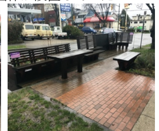
Figure. 3 NPO法人前パークレット