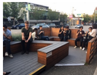
Figure. 2 飲食店前パークレット

多くのパークレットは飲食店前（Figure. 2）に設置されていた一方で、NPO法人の施設前に設置されるケースも見受けられた。市内のパークレットのうち、7ヶ所がNPO法人がオーナーであり、そのうちの5ヶ所はNPO法人が経営する飲食店前、残り2ヶ所はNPO法人の施設前（Figure. 3）に設置されていた。NPO法人はすべて異なる団体で、学童保育や料理教室に加え、外国人のための就職プログラムを開催するなど、地域内で様々な交流促進を図る団体が設置していた。