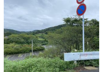
Figure 6: Untouched nature