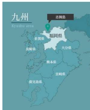
Figure 3: Fukuoka layout ※3

選定条件より、福岡市の北西部、博多湾に浮かぶ志賀島(しかのしま)に選定した。志賀島は漢委奴国王の金印が発見された場所として有名な島である。