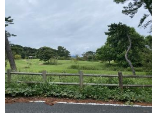
Figure 5: Untouched nature

しかし、島に渡る手前で楽しさが途絶えてしまっている。また、島を一周できるバス路線はなく、志賀島の自然を満喫するためには車が自動車という手段になることも楽しさの分断の要因になっている。