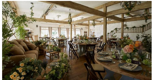
Figure 7: Image interior space ※4

素朴な白い塗り壁と天井の梁に施された古材の木組みが落ち着いた魅力を漂わせるナチュラルな空間。階段やオープンキッチンが設けられ、リビングのようなイメージの広々とした開放感あふれるレイアウトにする。