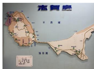
Figure 4: Shikanojima layout