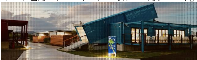
Figure 1. Painushima Resort [1]

2018年6月に石垣島にオープンした「ばいぬ島リゾート」は、石垣の海や山を満喫する際の拠点となるリゾートホテル。コンテナハウスを活用したコテージスタイルの部屋が全12棟、ツインとダブルの2種類が用意されている。