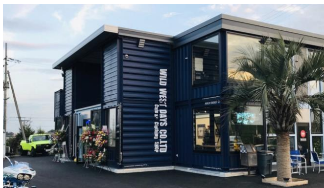
Figure 5. Wild West Days [5]

コンテナを活用したアメリカ雑貨ショップ。40 フィートコンテナ × 2 台, 20 フィートコンテナ × 8 台, 縦使いの 20 フィートコンテナ × 2 台と多様な輸送用コンテナを組み合わせしており、二層に計画