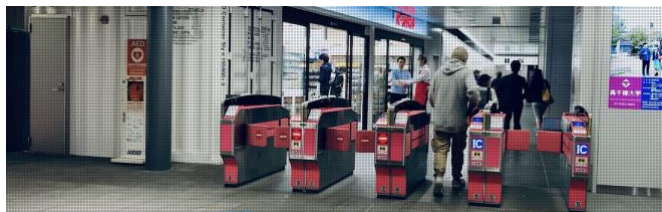
Figure 4. K-SHOP Shimokitazawa store [4]

2019 年 4 月に京王井の頭線北沢駅にオープンした駅ナカのコンビニ。輸送用コンテナの無骨な雰囲気は駅の改札と調和している。