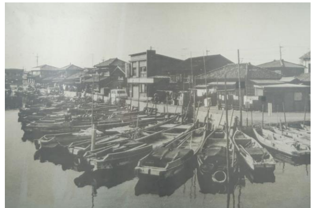
Figure 1 Urayasu city in the old days

今となってはディズニーの街として大成功した浦安市だが、かつては東京湾に面する「漁師の街」として栄えていた。当時の浦安の漁業の中心は海苔や貝類の養殖で、これらの生産高は全国トップクラスだった。浦安の食文化として定着したハマグリやアサリには栄養素が豊富に含まれており、浦安のガン死亡は全国平均を大きく下回っていた。