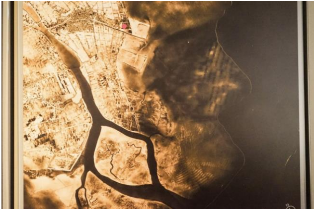
Figure 2 Sea polluted by the Black Water Incident

そこで浦安の漁民たちは、浦安の豊かさの象徴とも言える広大な浅瀬を捨て、そこで新しい産業を興して再び浦安の豊かさを取り戻そうと動き始めた歴史がある。