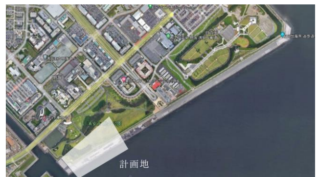
Figure 4 Planned site

新浦安地区の明海から日の出の海沿いを計画地とする。海沿いにはマンションやホテルが多くあり、集客が見込める。しかし、6mの高さがある護岸に遮られていることから海を眺めることは難しい。そして、下に降りる階段が少なく、行きづらいことから潮干狩り離れも改善しないと考えられる。それを改善することで、海を身近にし、歴史の復刻、コミュニティ形成を図る場所としてふさわしくなると考えられる。