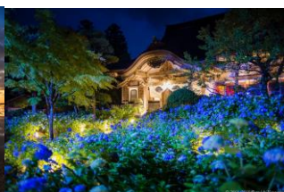
Figur.5 Unshoji Temple [7]