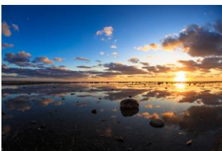
Figur.4 Unosaki Coast [6]