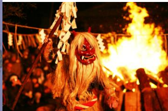
Figur.3 Namahage [5]