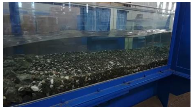
Photo 2. Flow condition at initial condition