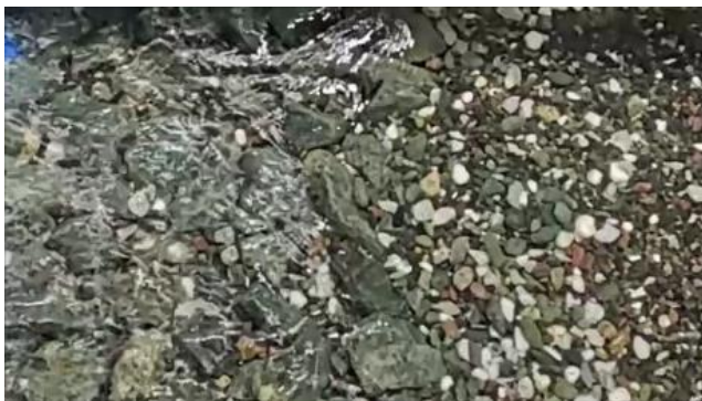
Photo 5. Flow condition during normal stage.

ときの流況を Photo 5 に示す。写真は最下流端の石組み帯工周辺の流況であり、石組み上では瀬が形成される。また、中間の石組み帯工周辺の流れは揺らぎが見られる程度にとどまった。これは石組み帯工の天端を結ぶ縦断勾配が小さいことにより、堰上げが生じたものと考えられる。なお、帯工間では常に淵が形成されている。これらのことから、石組みによる帯工の天端を結ぶ縦断勾配を瀬が形成されるように適切に選び、碎石によって帯工間の基盤を確保することによって、直線的な水路化した中で瀬と淵が形成されることが期待できる。