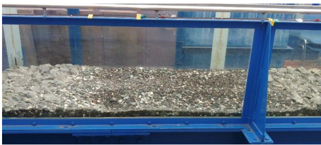
Photo 4. Bed profile after 10 hours.

均サイズが 5.3 mm の細石を中心に側壁側で掃流され、局所洗堀が生じている。また、石組みの上部に碎石や細石が隙間に堆積した状態になった (Photo 4)。また、水路中央部では細石が堆積し、左右で洗堀され、その箇所では碎石が残っている。10 時間後の底面形状を Figure 1 および Figure 2 に示す。ここに、x は流下方向の座標、y は水路中央を原点とする横断方向の座標である。また、G.L.は水路床を基準とした礫底面の高さを示す。図に示されるように、帯工状に石組みした箇所以外では堆積と侵食によって初期の状態と異なる底面形状になっている。10 時間後に平水規模の流量にした