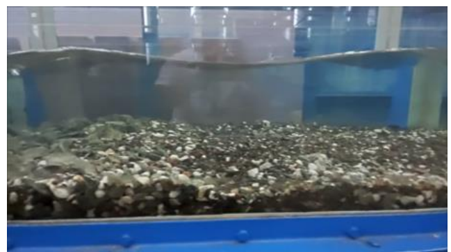
Photo 3. Flow condition after 10 hours