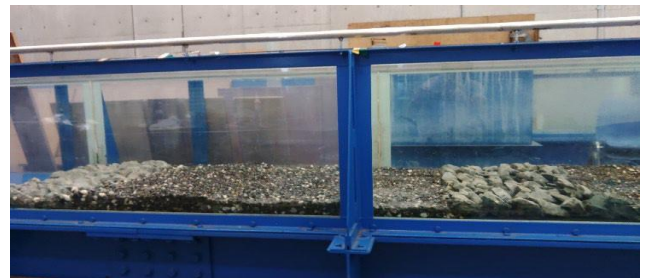
Photo 1. Installation of gravels and assembled boulders

水路長さ 15 m, 水路高さ 0.60 m, 水路幅 0.80 m の矩形水路に礫のサイズ（長辺と短辺と高さの総和を平均した長さ）の平均値が 93 mm の礫で 5 列 1 組の石組みを 3 箇所設置し、砕石の平均サイズが 16 mm および細石の平均サイズが 5.3 mm を帯工の間に設置している。設置の留意点として、砕石を帯工間の基本構造を構築し、その後、砕石と細石との混合を行う(Photo 1)。増水時の状態を再現するため、流量を Q=0.145 \text{ m}^3/\text{s} として、10 時間の通水を行った。通水後に底面形状をポイントゲージを用いて計測し、その後、平水時の流量規模に設定し、流況を確認した。