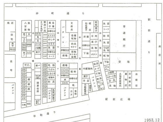
Figure1. 1953年当時のハモニカ横丁

現在のハモニカ横丁は東京における多くの横丁と同様にかつて闇市であった. 闇市およびそれを起源とするマーケットの多くは戦後の露店整理や都市再開発によって移転・撤去されたが, ハモニカ横丁は戦前から立地を変えずに現在まで取り残されている稀有な例である. ここで, 闇市の一般的な歴史を整理しながら, 戦前~1960年代のハモニカ横丁を把握する. 闇市とは経済統制のもとで公的には禁止された流通経路を経た物資を扱う市場のことである. 闇市は主に駅周辺の建物疎開地に設けられることが多かったが, 吉祥寺駅周辺地域には空襲の標的になりやすい軍需工場があったため, 吉祥寺駅前は建物疎開地となり, この場所に闇