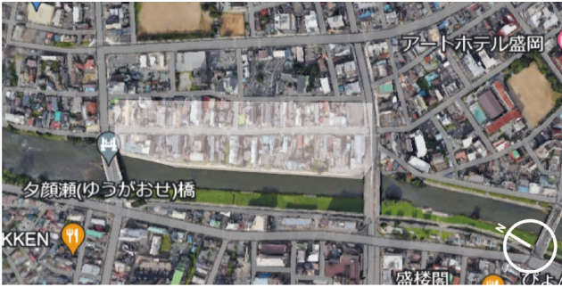
Figure3. Planned site "Zaimoku-town" [4]