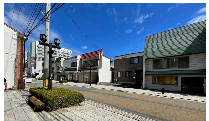
Figure2. Non-hosting day