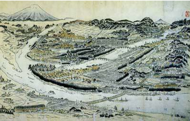
Figure4. The old city of Morioka [6]

明治の中頃,東北本線が開通するまで,北上川は荷物や人を運搬するとても大切な交通路の役割を担っていた。しかし,今日では鉄道や自動車などの陸上交通の発達によって,かつて舟運が行われていた。 [5]