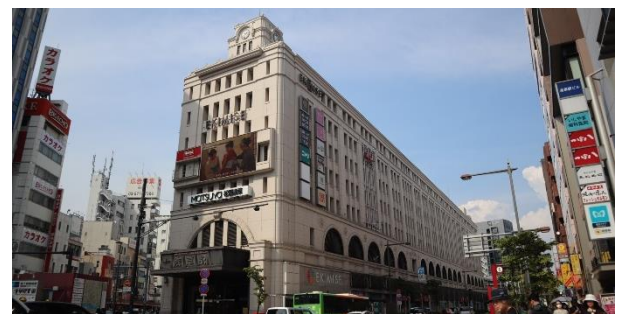
Figure 2. Photo of Tobu Asakusa Station

駅舎を出てすぐに半径100mの急カーブが存在し、15 km/hの速度制限がかかっている。ゆっくりと隅田川を渡る風景は浅草らしい情緒を伴ってはいるが、車輪とレールの摩擦音による騒音問題などを引き起こしている。また、立地によりホームの先端も急カーブにかかっており、ホームの延長が不可能なことから、車両の全てが入りきらず事故も多く発生している。