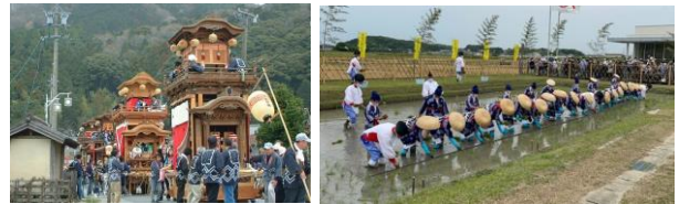
Figure.2 Rokutsumi Yuki Saita Rice Planting Festival [1]

六ツ美悠紀斎田お田植えまつり(六ツ美町)むらさき麦まつり(藤川町)などの一年の豊作を願う祭り。