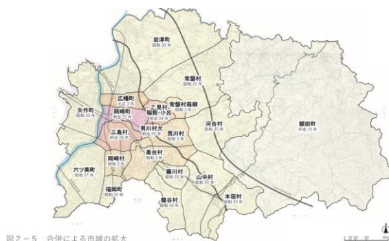
図2-5 合併による市域の拡大

愛知県岡崎市、ここは明治22年の岡崎町が市町村合併を繰り返し平成18年の額田郡合併によって現在の形へと変化してきた。しかしもともとは小さな村、町であったため各地域に特色ある祭りや風習が残る。