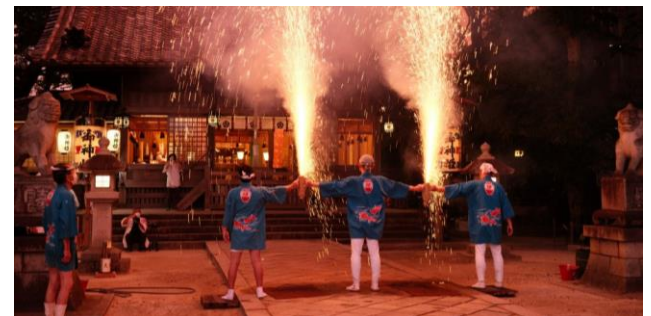
Figure.4 Sugo Tetsutsu Fireworks [1]

岡崎市花火大会(岡崎町)菅生手筒花火(岡崎町)天満天神祭手筒花火(岩津町)滝山寺(常盤村)などの花火関連の祭り。花火は軍事用の火術が観賞用に変化したもので一揆や反乱を抑えるために徳川は製造貯蔵を三河地方飲みに制限したため、現在でもトップレベルの技術を誇り多くの人が訪れる市の祭りのほかに各町内で行う祭りがある。 [2]