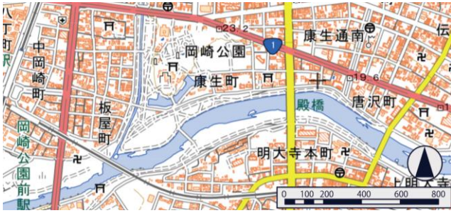
Figure 5.5 Site Map [3]