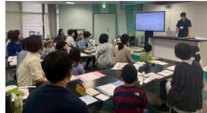
Figure 2. Scenes from the workshop