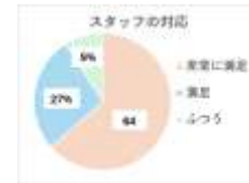
Figure 3. satisfaction with staff response

来場者へのアンケートの結果を Figure 3, 4 に示す。「スタッフの対応」については 63.6%が、「星空解説」については 81.8%が「非常に満足」と回答した。