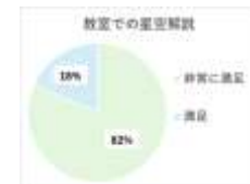
Figure 4. Commentary satisfaction survey