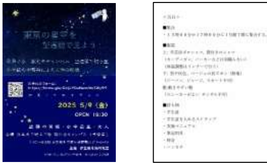
Figure 2. Stargazing Event Poster and Staff Handbook

過去に実施した際の船橋キャンパスでの観望会のマニュアルを参考に駿河台キャンパス用に作成した。