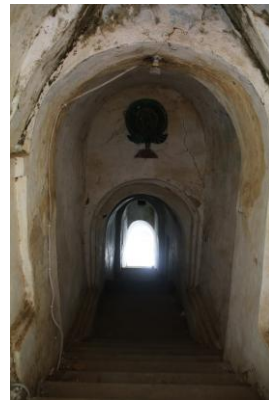
写真1 Taung-Kyanzittha-umin の階段 (左)