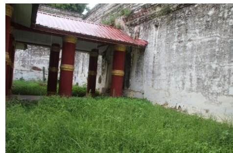
写真3 Taung-Kyanzittha-umin の廊下 (左)