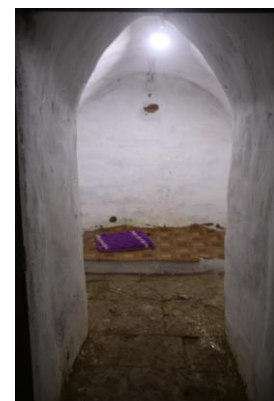
写真4 Taung-Kyanzittha-umin の房 (右)