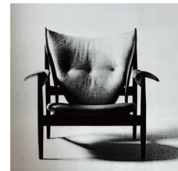
Figure 2. The Chieftain Chair, a collaborative work by Finn Juhl and cabinetmaker Niels Voder

により、安く手に入りやすいドイツ製品が大量に流入し、国内家具産業の衰退を恐れ、消費者に自国の高品質家具を知る機会を作り、安い輸入家具に流れていくのを防ぐ目的で開催された。初めは各キャビネットメーカーの作品の発表の場として位置づけられていたが、1933年にデザインコンペティション制度が導入され、デザイナーと職人の協働での制作活動が活発になり、この展覧会に促され、長期にわたって協同制作を続けたデザイナーと職人が多くいる。その一人であるフィン・ユールはニールス・ヴォッダーとの20年以上協同制作と続けた。家具職人だけでなく、マイスターの資格を持っていたデザイナーがいたこともあり、デザイナーと職人が対等な関係にあったことで、デザイナーが理想とした形を再現させることが可能であった。またデザイナーの理想を形にできた家具職人の技術の高さが評価されるようになった。このギルド組織の活動は、家具職人や技術者の仕事を確立させ、北欧デザインにおいて欠かせない職人の存在を守ったと言えるだろう。